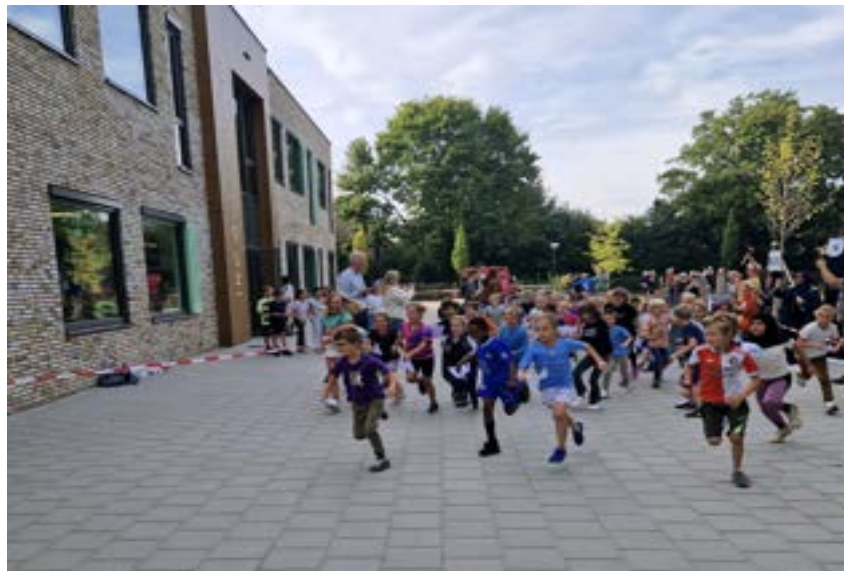
De jaarlijkse sponsorloop is ook een gezamenlijke activiteit