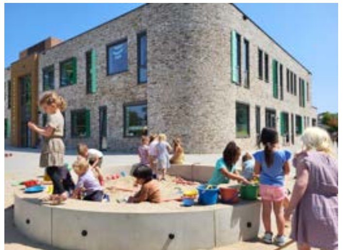
Fijn spelen op ons mooie plein!

Ook willen we uw aandacht voor het afscheid nemen. Fijn als u het afscheid kort kunt houden, en niet tijdens de schooluren op de ramen klopt of zwaait naar uw kind..... Zo kunnen we in alle groepen om 8:35 uur starten.