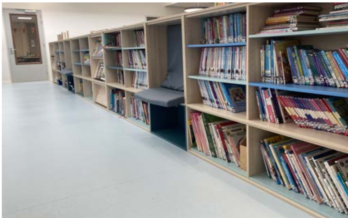
Onze geweldige bibliotheek op de bovenverdieping